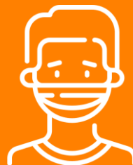
Produção e distribuição de máscaras