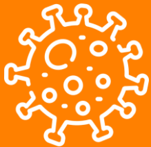
Ações educativas de prevenção ao corona vírus