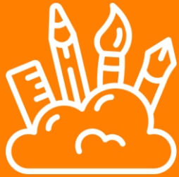
Atividades socioeducativas online