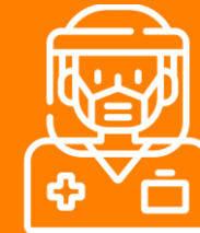
Produção de EPIs -Dimpi Gestão e saúde