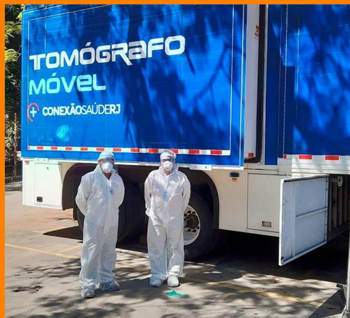
CASA ARTE VIDA