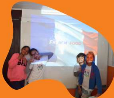
Ratatouille (cooking verbs)