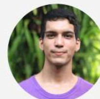
MARCELO SALES TECNOLOGIA