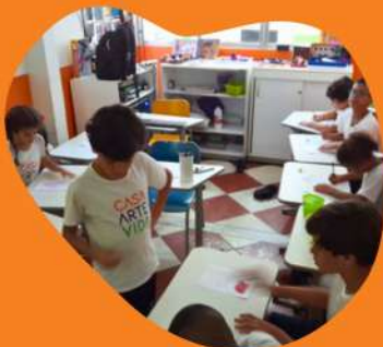
The Clown of Shapes