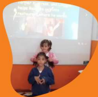
Ratatouille (Mr Alfredo and Remy)