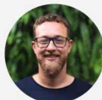
JOÃO VITOR ARCHANJO TECNOLOGIA